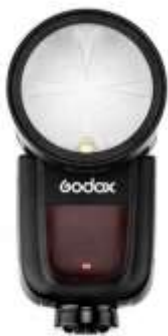
FLASH GODOX V1

MIGLIORE IMMAGINE MINIMALISTA MIGLIOR IMMAGINE SUL MONDO DEGLI ANIMALI