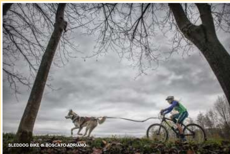
SLEDDOG BIKE di BOSCATO ADRIANO