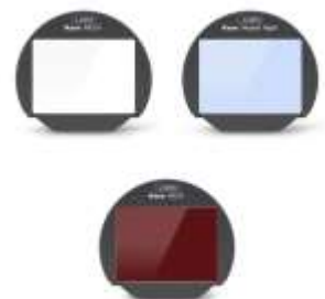
3 in 1 set: MCLV+Neutral Night+ND16