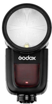
FLASH GODOX V1

MIGLIOR IMMAGINE SUL MONDO DEGLI ANIMALI